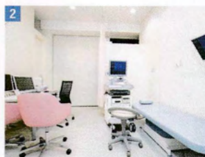
1 広々とした待合室。女性にやさしいデザイン。2 診察室。ベッド横で検査中とモニターで映像を見ることが可能

医療法人社団 清陵会 丸茂レディースクリニック 産婦人科 4Dエコー検査/妊婦健診