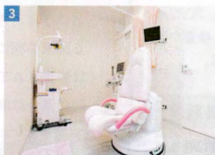
3 受診者の緊張を和らげるためにピンクで統一された内診室

4Dエコーではおなかの中の赤ちゃんの様子が立体的かつリアルタイムに映し出されるため、成長具合を細かくチェックすることはもちろん、その表情やしぐさまでも見ることができる。機械の性能や医師の技量によっても映像に差が出るそうだが、超音波の専門家として高度な技術を有する院長が映し出す赤ちゃんの姿は、実に鮮明。また妊娠初期から検査が可能のため、「映像を見て実感が生まれ、うれしさも感じられると思いますよ」と話す。