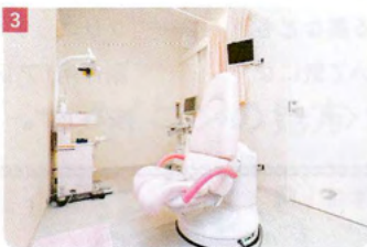
3 受診者の緊張を和らげるためにピンクで統一された内診室

4Dエコーではおなかの中の赤ちゃんの様子が立体的かつリアルタイムに映し出されるため、成長具合を細かくチェックすることはもちろん、その表情やしぐさまでも見ることができ。機械の性能や医師の技量によっても映像に差が出るそうだが、超音波の専門家として高度な技術を有する院長が映し出す赤ちゃんの姿は、実に鮮明。また妊娠初期から検査が可能のため、「映像を見て実感が生まれ、うれしさも感じられると思いますよ」と話す。