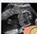
FTA (胎児顔種横断面径)